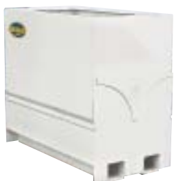
SESAM 1400 Vit