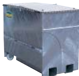
SESAM 1400 Varmförzinkad och utrustad med hjul och tvådelat lock