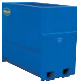
SESAM 1400 Blå standard