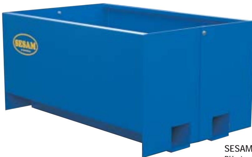
SESAM 900 Blå standard