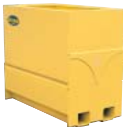
SESAM 1400 Gul