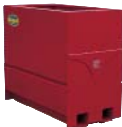
SESAM 1400 Röd