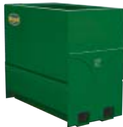
SESAM 1400 Grön